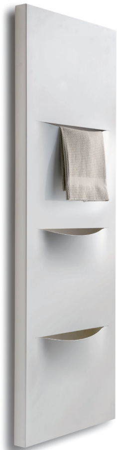
design by Alessandro Canepa

Interasse dal centro foro al muro 40 mm. Distance between hole center and wall 40 mm. Distance du centre du trou au mur 40 mm. Abstand zwischen Lochmitte und Wand 40 mm. Distancia entre el centro del agujero y el muro 40 mm. Расстояние между центром отверстия и стеной – 40 мм.